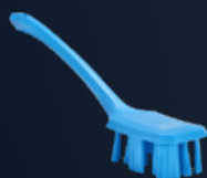
Brosse à main UST, manche long, Dur Référence: 4196x