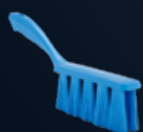
Balayette UST, Medium Référence: 4585x