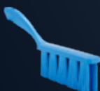
UST Balayette, Souple Référence: 4581x